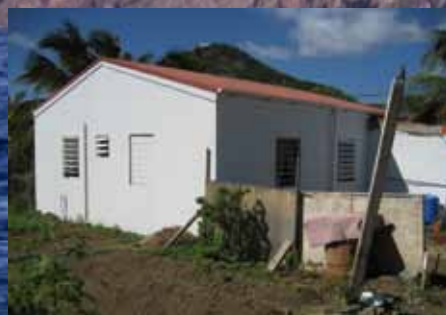
Woningen die Statia Housing Foundation op Sint Eustatius verhuurt.