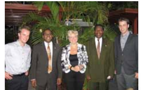
De lokale en Woonlinie-afgevaardigden

Woonlinie is niet de enige corporatie die actief is aan de andere kant van ons koninkrijk. Ook de corporaties Vestia, met vestigingen in Rotterdam, Den Haag, Delft en Zoetermeer en Mitros in Utrecht verzetten er werk.