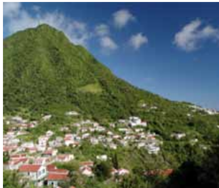
De mogelijke nieuwbouwlocatie Underneath the hill op Saba

Op kleine schaal wordt er ook nieuwbouw gepleegd op de twee eilanden. Dat is nog niet zo makkelijk omdat er sprake is van een heuvelachtig landschap. Ook moeten alle bouwmaterialen over zee aangevoerd worden en moeten de huizen tegen orkanen bestemd zijn! Op beide eilanden zijn locaties uitgezocht waar nieuwe woningen gebouwd kunnen worden. De eerste tekeningen worden gemaakt.