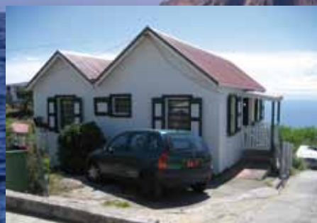
Woningen die Own Your Own Home Foundation op Saba verhuurt.